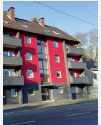
ROSSBACHSTRASSE 1, RAHMER STRASSE 24/26/36, DORTMUND