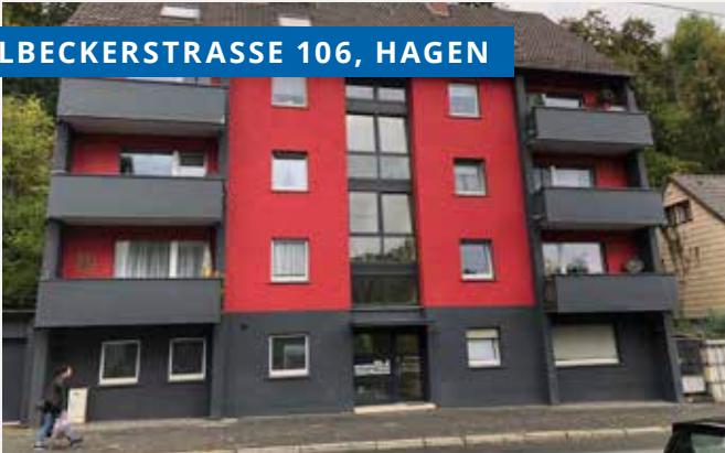
SELBECKERSTRASSE 106, HAGEN